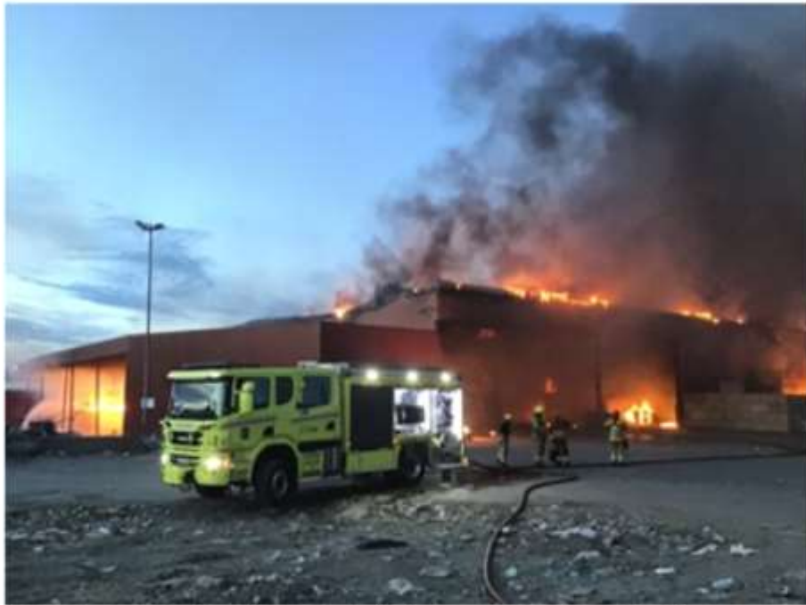
Papiranlegget sto ikke til å redde i storbrannen.